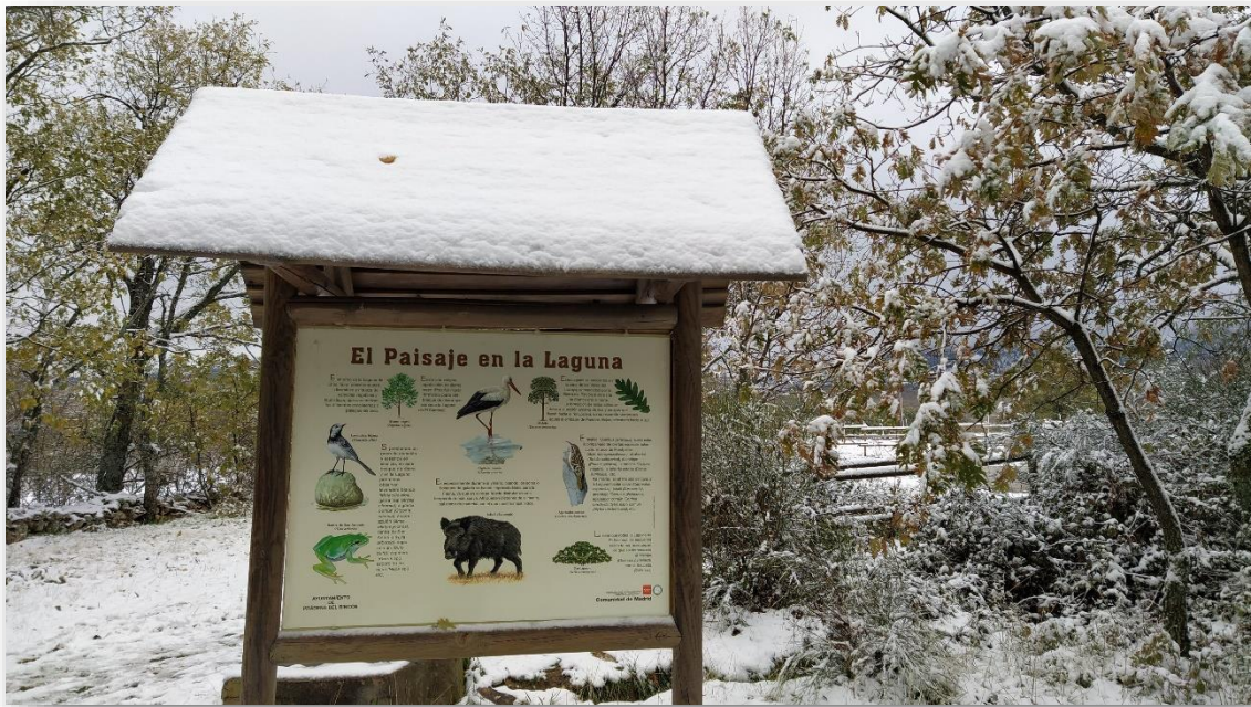
Laguna del Salmoral (Prádena del Rincón)

También hemos visto como los fotogénicos serbales de cazador y acebos de las laderas de Prádena del Rincón y Puebla de la Sierra ya no tienen sus frutos rojos, las aves se los han ido comiendo como suplemento alimenticio del invierno. Gracias a las lluvias y a la nieve que cayó en las cumbres ahora las praderas están verdes, como en otros lugares de España la lluvia y las primeras nieves fueron muy esperadas por todos. Los charcos aparecen helados todas las mañanas y sobre los animales una fina capa de escarcha.